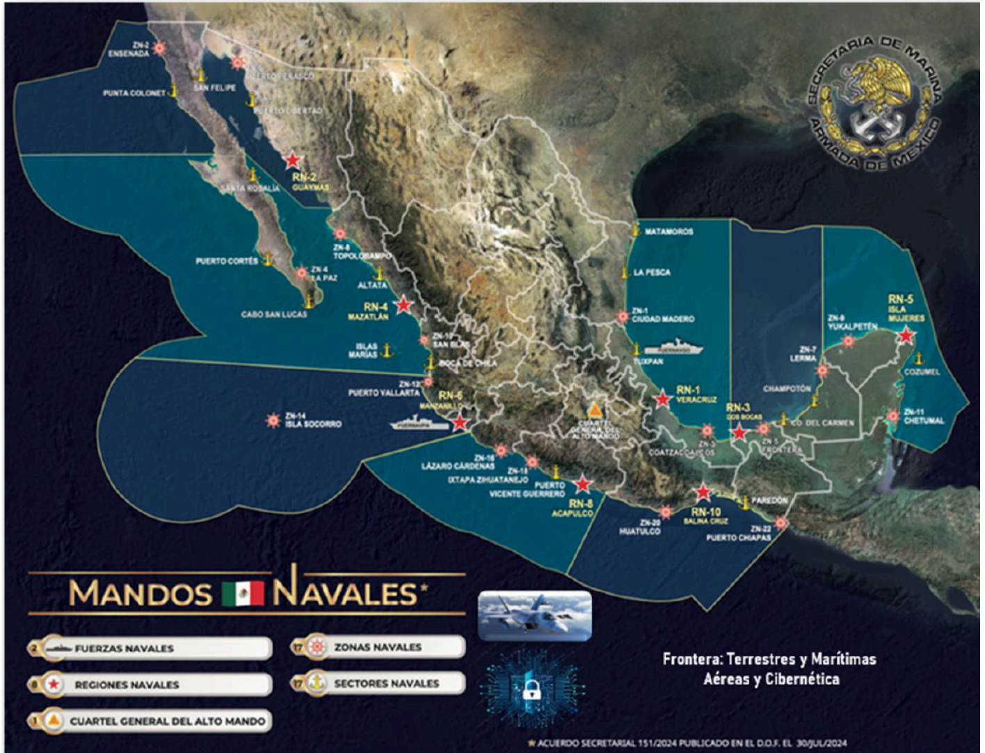
Figura 2: Fronteras Terrestres, marítimas, aéreas, cibernéticas

La frontera norte de México y sur para los Estados Unidos, es un punto de reflexión y vigilancia por su multidimensionalidad, en términos de su desarrollo y seguridad. La tarea de seguridad se vuelve un reto debido a su vasta extensión territorial, compuesta por una superficie total de México de 5,114,295 km 2 .