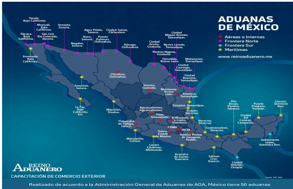
Figura 1: Aduanas de México (Proyectos México, 2025)

La seguridad en las fronteras compartidas es uno de los principales desafíos de los Estados parte, esto implica la protección de su soberanía, integridad territorial, seguridad y defensa nacionales, así como implementar acciones para identificar, neutralizar o eliminar factores en su seguridad interior que representen un riesgo o una amenaza para la seguridad en sus fronteras.